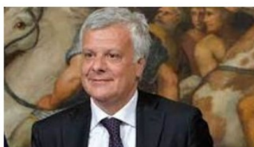
Gian Luca Galletti